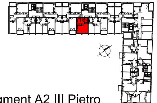
Segment A2 III Piętro

SEMACO II Sp. z o.o. Sp. K. ul. Saska 9/6 30-715 Kraków tel: 12 290 53 06 www.solarispark.pl