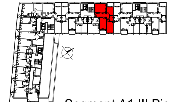
Segment A1 III Piętro

SEMACO II Sp. z o.o. Sp. K. ul. Saska 9/6 30-715 Kraków tel: 12 290 53 06 www.solarispark.pl