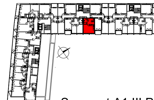
Segment A1 III Piętro

SEMACO II Sp. z o.o. Sp. K. ul. Saska 9/6 30-715 Kraków tel: 12 290 53 06 www.solarispark.pl