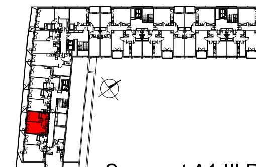
Segment A1 III Piętro

SEMACO II Sp. z o.o. Sp. K. ul. Saska 9/6 30-715 Kraków tel: 12 290 53 06 www.solarispark.pl