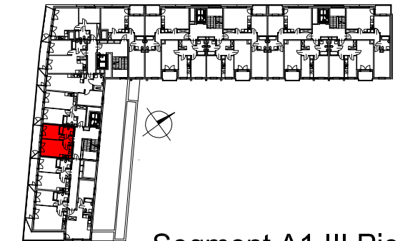
Segment A1 III Piętro

SEMACO II Sp. z o.o. Sp. K. ul. Saska 9/6 30-715 Kraków tel: 12 290 53 06 www.solarispark.pl