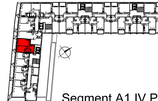
Segment A1 IV Piętro

SEMACO II Sp. z o.o. Sp. K. ul. Saska 9/6 30-715 Kraków tel: 12 290 53 06 www.solarispark.pl