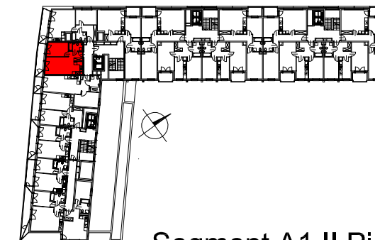
Segment A1 II Piętro

SEMACO II Sp. z o.o. Sp. K. ul. Saska 9/6 30-715 Kraków tel: 12 290 53 06 www.solarispark.pl