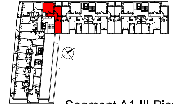
Segment A1 III Piętro

SEMACO II Sp. z o.o. Sp. K. ul. Saska 9/6 30-715 Kraków tel: 12 290 53 06 www.solarispark.pl