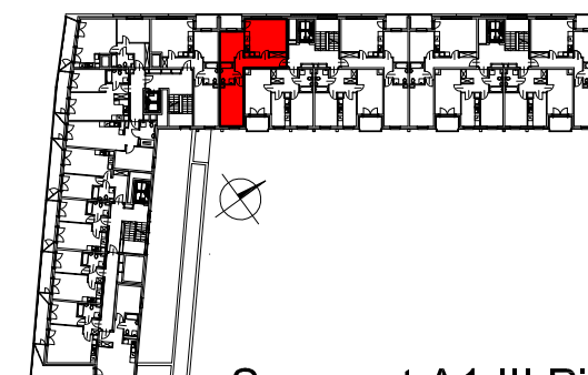
Segment A1 III Piętro

SEMACO II Sp. z o.o. Sp. K. ul. Saska 9/6 30-715 Kraków tel: 12 290 53 06 www.solarispark.pl