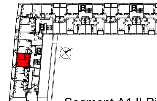
Segment A1 II Piętro

SEMACO II Sp. z o.o. Sp. K. ul. Saska 9/6 30-715 Kraków tel: 12 290 53 06 www.solarispark.pl