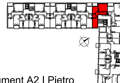
Segment A2 I Piętro

SEMACO II Sp. z o.o. Sp. K. ul. Saska 9/6 30-715 Kraków tel: 12 290 53 06 www.solarispark.pl